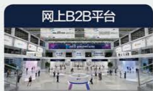
网上B2B平台 无时空限制 提供企业宣传机会