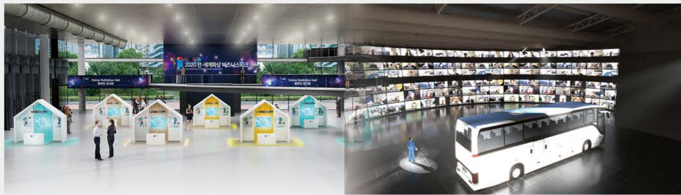
由展示韩国高度发展的技术和产品的“网上虚拟产业展示会”和各产业投资及技术说明会组成的“e-国际商务会议”