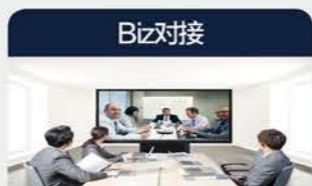
Biz对接 世界华商企业与韩国企业间 有实效的商业对接

开闭幕式 主旨演讲、VIP演讲 在线直播 国际商务会议 华商、韩国Leaders Forum