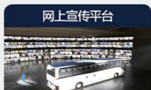
网上宣传平台 宣传产品及技术 产业PR SHOW