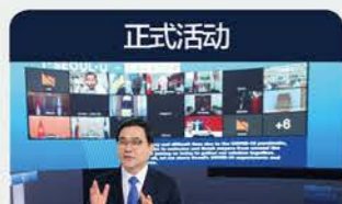
正式活动 韩国-世界华商 商务合作仪式